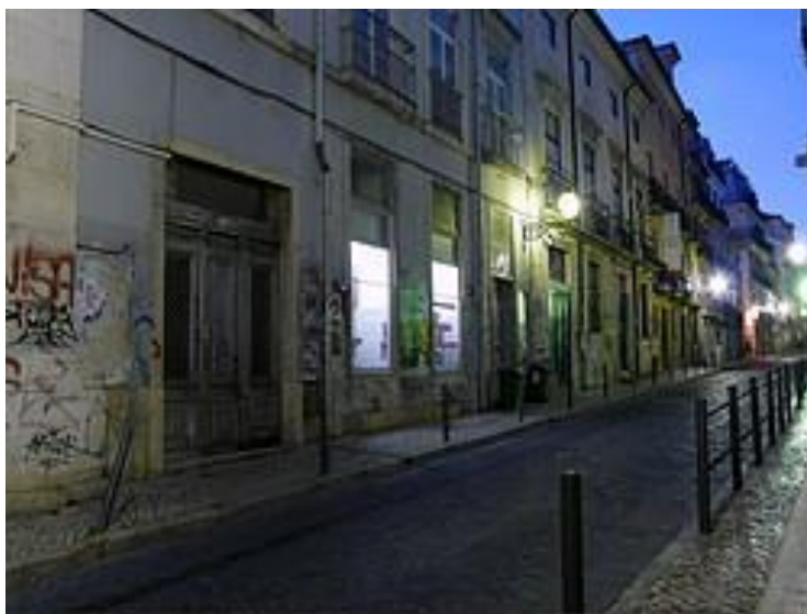
Barrio Alto al anochecer

Representan la Lisboa más bohemia y alternativa. Algunos definen El Chiado como el Montmartre de Lisboa.