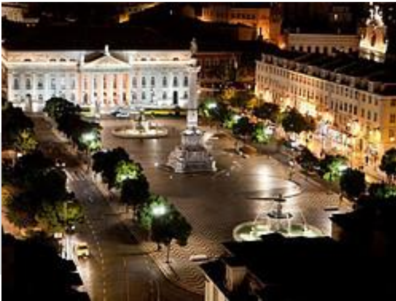
Plaza del Rossio

La Plaza del Rossio es la zona más animada de Lisboa. En sus alrededores abundan los bares y restaurantes y es el lugar de quedada de lisboetas y visitantes.