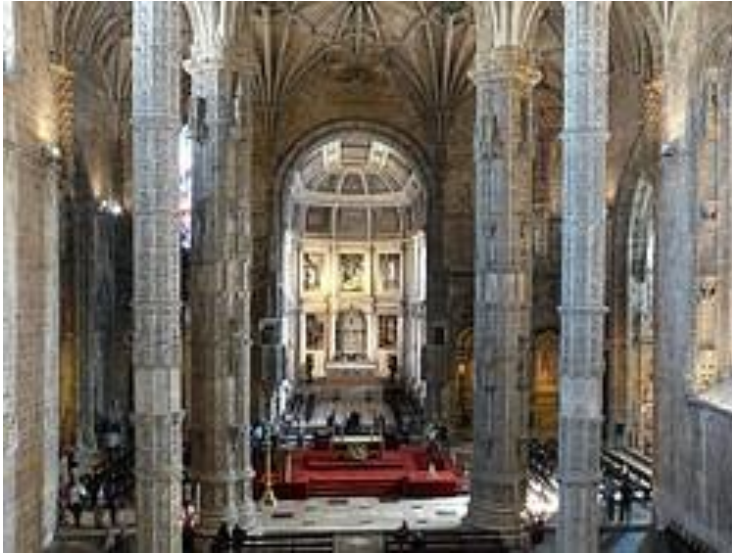
Iglesia del Monasterio de los Jerónimos