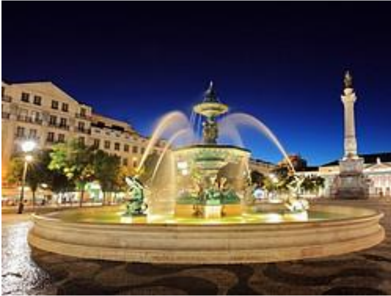
Una de las fuentes de la Plaza Rossio

La Plaza del Rossio, oficialmente llamada Plaza Don Pedro IV, es el centro neurálgico de Lisboa. Está situada en La Baixa , en el extremo norte de la Rua Augusta y a poca distancia de la Plaza de los Restauradores. La Plaza del Rossio es la zona más animada de la ciudad y el lugar de cita de los lisboetas y visitantes. En los lados de la plaza y en sus calles aledañas encontraréis tiendas, bares y restaurantes de los más famosos de la ciudad.