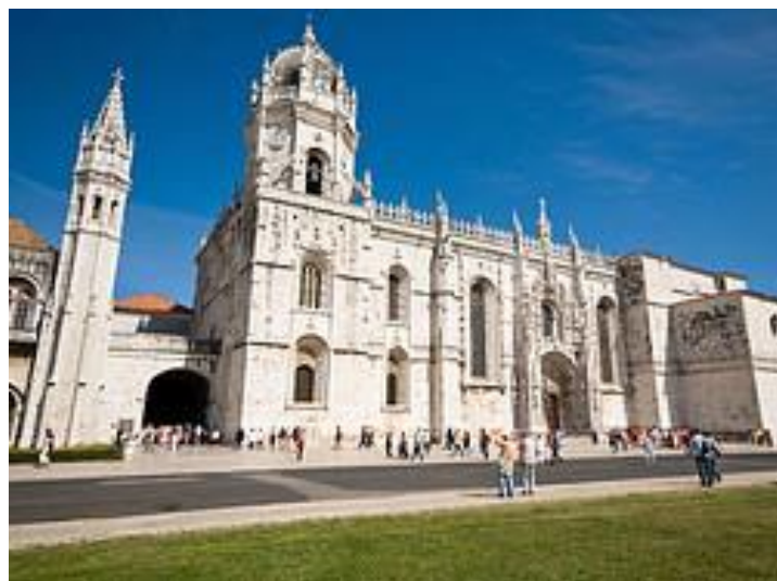
Monasterio de los Jerónimos

El Monasterio de los Jerónimos es, junto a la Torre de Belém, la visita turística más importante de Lisboa. En su interior se encuentra la tumba de Vasco de Gama.