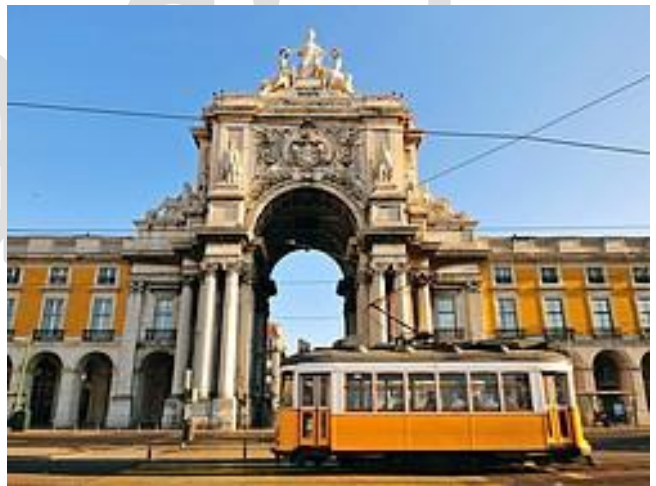
Plaza del Comercio Arco Triunfal da Rua Augusta

La Plaza del Comercio (Praça do Comércio) es la plaza más importante de Lisboa. Fue construida donde estuvo situado el palacio real antes de ser destruido por el gran terremoto de 1755. La fisionomía de la Plaza del Comercio se compone de un conjunto de edificios porticados en tres de sus lados y está abierta en el lado sur, mirando al Tajo. Históricamente ahí llegaban los barcos mercantes y ésta era la puerta de Lisboa.