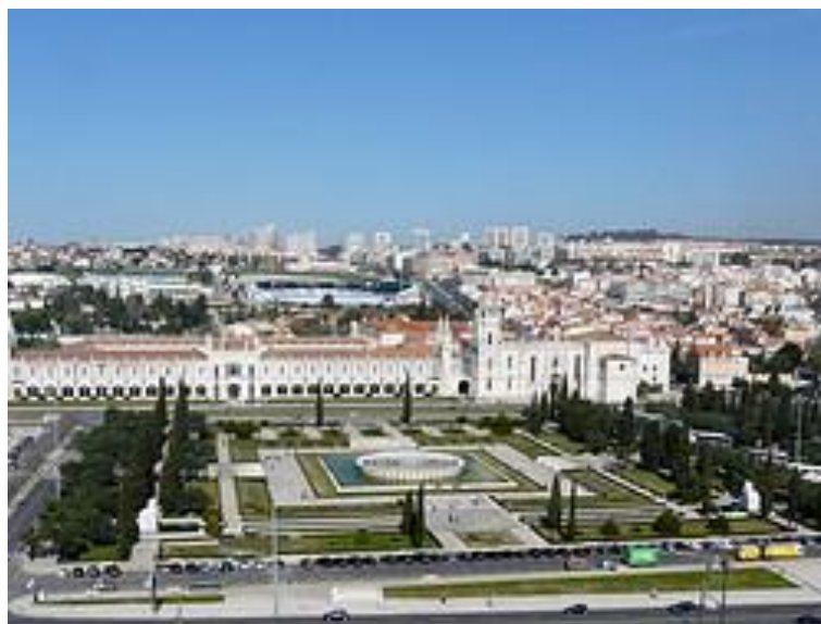
Los Jerónimos, desde los Descubridores

En Belém se encuentran algunos de los monumentos más importantes de Lisboa y su visita es imprescindible.