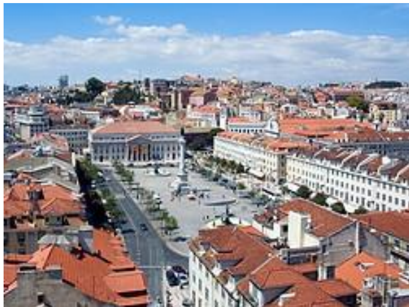
Plaza del Rossio (Plaza Don Pedro IV)