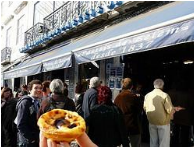
Los famosos pasteles de Belém

Lejos del centro pero muy bien comunicado, río abajo donde el Tago se funde con el mar, se encuentra el barrio de Belém. Barrio de donde partieron los exploradores portugueses que tanta gloria dieron a Portugal, conquistando gran parte del mundo.